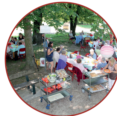
Pique-nique inter-résidences aux Clématis

La priorité est donnée aux résidents de Chambéry et Sonnaz.