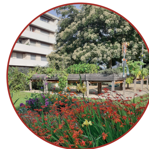
Le jardin de la résidence

La priorité est donnée aux résidents de Chambéry.