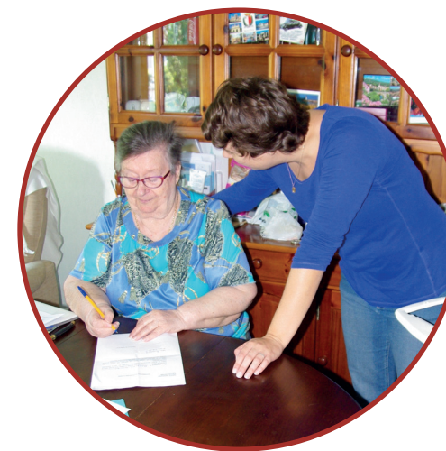
Aide à la vie quotidienne